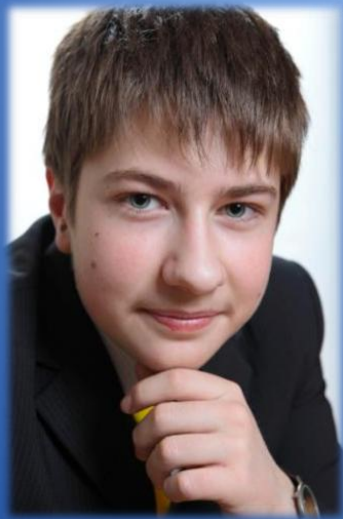
Кирилл Фёдорович Федченко, министр спорта

Призер Республиканской олимпиады юных изобретателей «Кулибины 21 века», победитель республиканской Открытой научно- практической конференции старшекласников «Энергетика и энергетические ресурсы»